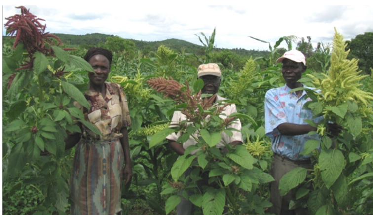
Figure 3 : Variétés d'Amarante utilisées dans la production massive de graines consommables et des semences