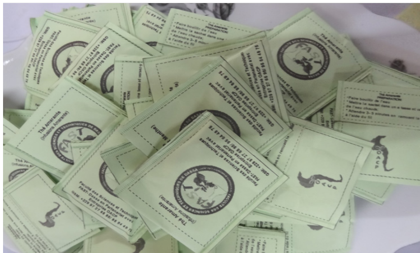
Figure 7 : Valorisation de l'Amarante sous forme de thé aromatisé à la menthe

Malgré l'importance de ce légume, certaines contraintes liées à la production, la transformation, la distribution et la commercialisation entravent son épanouissement et le main-