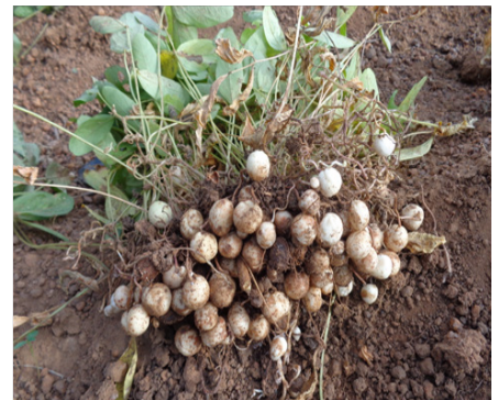
Figure 2 : Pied de voandzou récolté montrant les gousses contenant les graines

Cette valeur nutritive fait d'elle un excellent complément des céréales et tubercules qui sont à la base de l'alimentation en Afrique subsaharienne. Le voandzou est produit principalement pour ses graines sèches consommées par l'homme comme tout légume sec. Ses graines sont utilisées dans la fabrication du lait végétal comparable au lait de soja. La farine du voandzou peut remplacer d'autres farines conventionnelles en fonction des transformations qu'elle subit. Les graines sont aussi utilisées dans l'alimentation des porcs et des volailles et les feuilles comme fourrages dans certains pays.