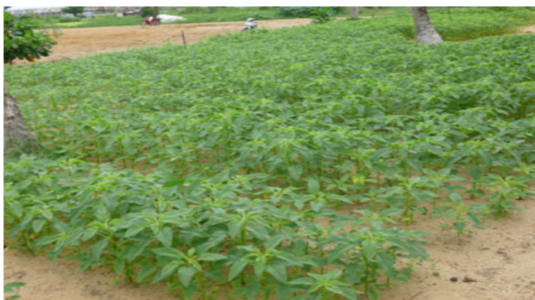
Figure 2 : Amaranthe dans un jardin maraicher à Cotonou