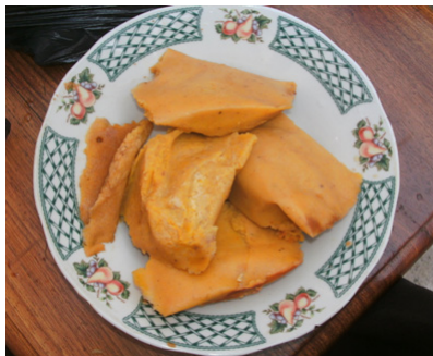
Figure 5 : Aliment traditionnel Abla préparé avec la farine de Voandzou

Les recherches sur le voandzou en Afrique ont porté jusqu'ici sur des aspects phytotechniques, biochimiques et de diversité génétique. Des études phytotechniques ont été menées notamment en ce qui concerne les amendements en engrais et le meilleur conditionnement des graines pour faciliter la germination. L'influence de la température et de la durée de l'éclairage sur la germination, la croissance et le développement