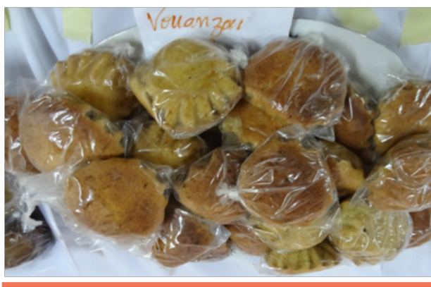
Figure 7 : Gâteaux faits avec la farine de voandzou enrichis au Moringa