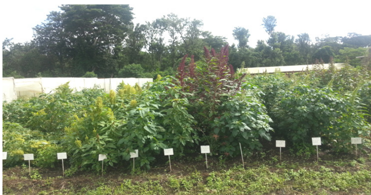
Figure 1 : Collection d'espèces d'Amarante dans un centre de recherche au Kenya

L'amarante ( Amaranthus spp) est un légume traditionnel dont les feuilles et les graines sont consommées sous diverses formes. Au Bénin, il existe plusieurs espèces mais Amaranthus cruentus est la plus cultivée et la plus consommée. Les feuilles sont riches en protéines, en vitamine C, en bêta-carotène, en fer et en calcium.