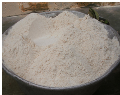
Figure 4 : farine de voandzou prête à différentes utilisations