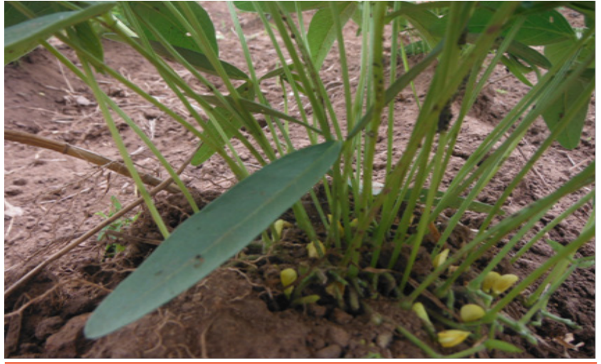
Figure 8 : Floraison chez le voandzou

Le voandzou est préférentiellement autogame mais des fécondations croisées sont observées entre certaines variétés. La période de fécondation est marquée par l'intervention de deux espèces d'insectes Formicidae ( Pheidolemegacephala (Fabricius) et Monomoriumpharaonis (Linnaeus) qui facilitent la nouaison et la pénétration des gousses dans le sol. Le développement des gousses précède la maturation des graines.