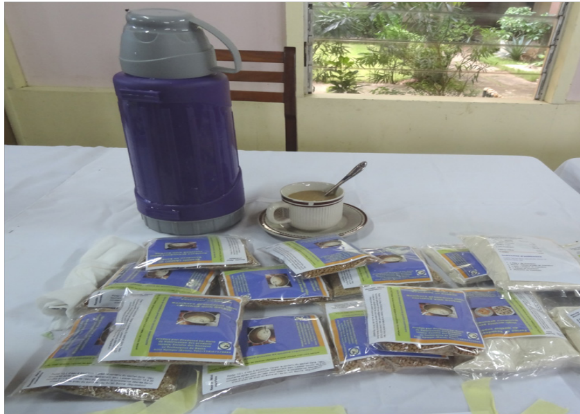
Figure 6 : Granulés ou Aklui faits à partir de la poudre de l'Amarante et de la farine de patate douce à chair orange riche en vitamine A. Ce complexe est utilisé pour des bouillies instantanées pour combattre la malnutrition