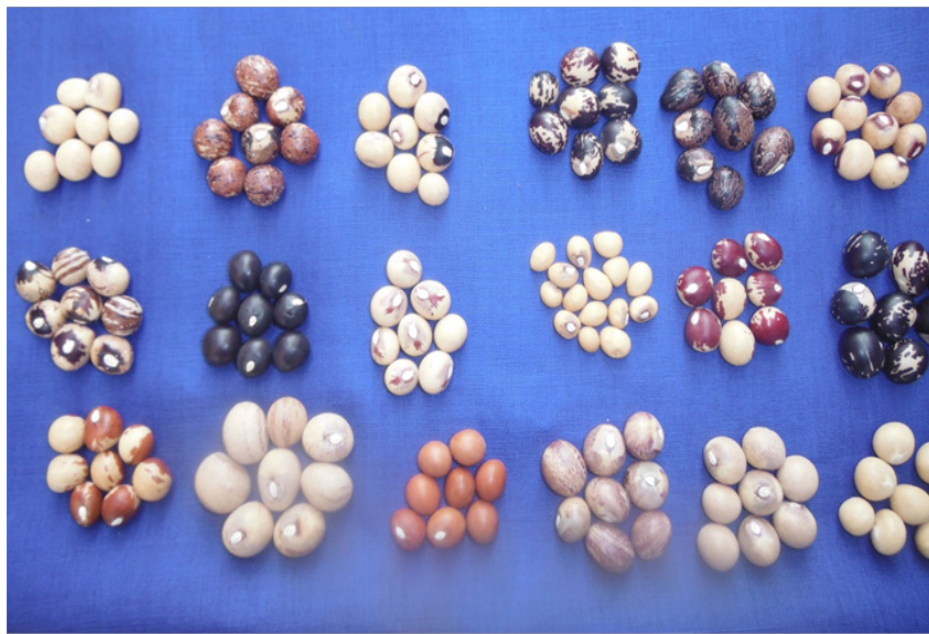
Figure 3 : Graines de quelques variétés de voandzou cultivées au Bénin

nin n'est pas représenté dans les collections africaines. C'est une espèce négligée et sous utilisée au Bénin malgré qu'elle soit une culture d'avenir en raison de son importance alimentaire et économique.