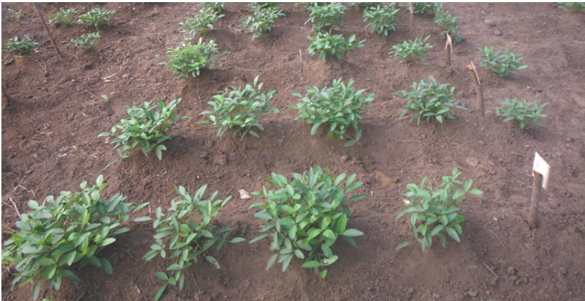
Figure 1 : Pieds de Voandzou dans un champ expérimental à la FAST de Dassa

Le voandzou ( Vigna subterranea L. Verdc) originaire d'Afrique de l'Ouest, est une légumineuse à graines qui appartient à la famille des papilionaceae ( 2n = 2x = 22 ). Les graines constituent une source de protéine (19-25%), de carbohydrates (63%), de fibres (6,5%) et d'acides aminés essentiels pour l'homme.