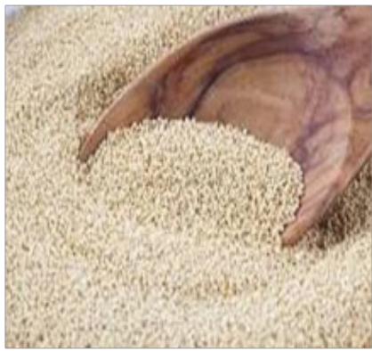
Figure 4 : Graines d'amarante

ment du potassium et du zinc. Elle contient de la lécithine favorable au système nerveux et cérébral. Elle est riche en vitamines du groupe B (B6, folates ou B9 et acide pantothénique ou B5). Ses graisses sont faites de 70% d'acides gras polyinsaturés ce qui la rend utile pour la mémoire, pour conserver une bonne immunité et nous aider à lutter contre les inflammations. Elle est constituée aussi d'une grande quantité de fibres et ne contient pas de gluten. Avec cette richesse nutritionnelle la graine d'amarante est donc un aliment de choix pour les femmes enceintes, les convalescents, les végétariens, les personnes âgées, et les enfants en pleine croissance. Sa richesse en calcium en fait un aliment préventif de l'ostéoporose. Elle est utilisée par les paysans comme un tonique pour les personnes âgées et un remède souverain contre la diarrhée et les hémorragies internes ou externes.